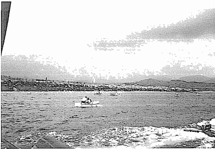
Il Palio di San Matteo edizione 2009

- Palio di S. Matteo - gara di gozzi storici La gara si svolge all'imbrunire, il campo di gara viene illuminato da torce ad olio galleggianti, i gozzi sono addobbati con fiori e decorazioni tradizionali. Molto suggestiva è la preparazione delle barche: le banchine del porto diventano il palcoscenico per i proprietari dei gozzi che fin dal mattino iniziano i preparativi per la gara.