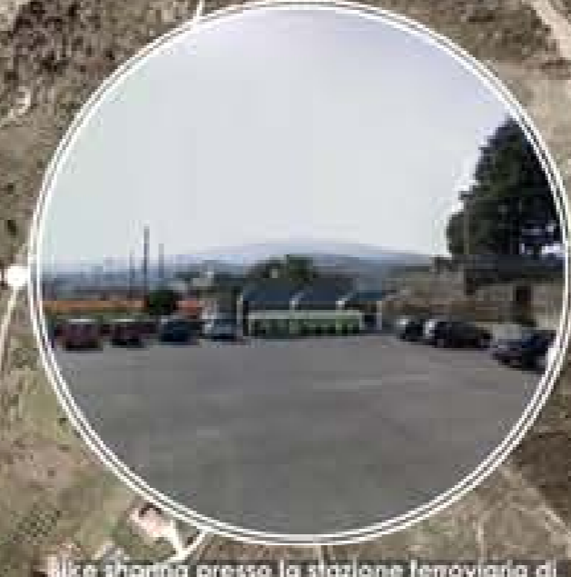
Bike sharing presso la stazione ferroviaria di Omignano - fotoinserimento