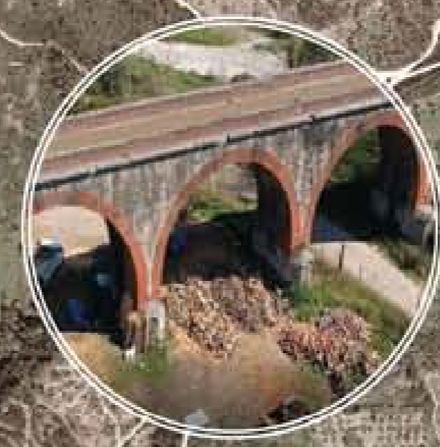
Recupero ponte ferroviario dismesso - fotoinserimento e sezioni