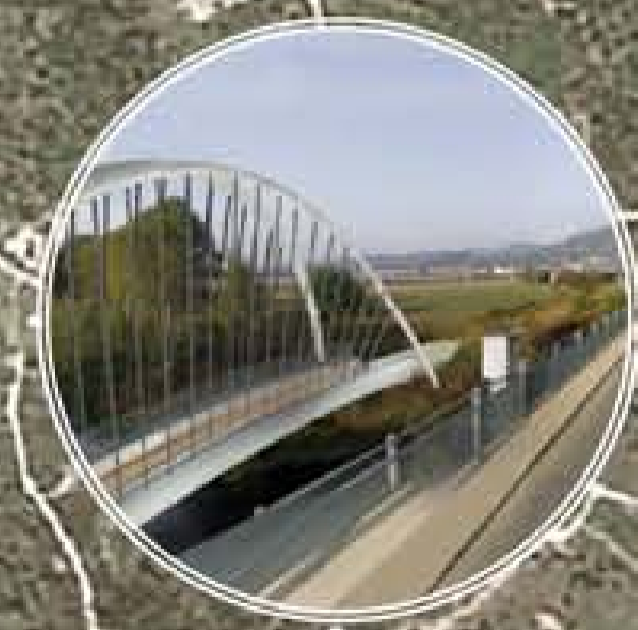
Passerella ciclo-pedonale - foto/interimenti e prospetto