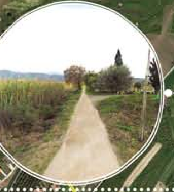
Ciclovia - foto/interimento